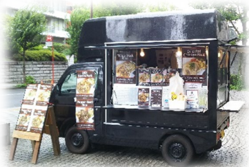
日替わりで営業する フードトラック