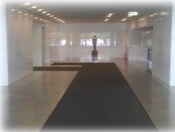
高級感あふれる 広いエントランス