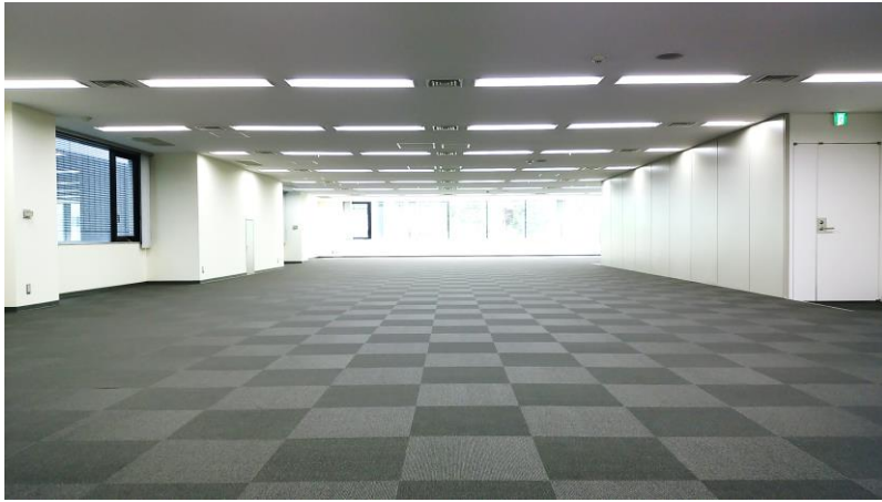
■基準階フロア内観